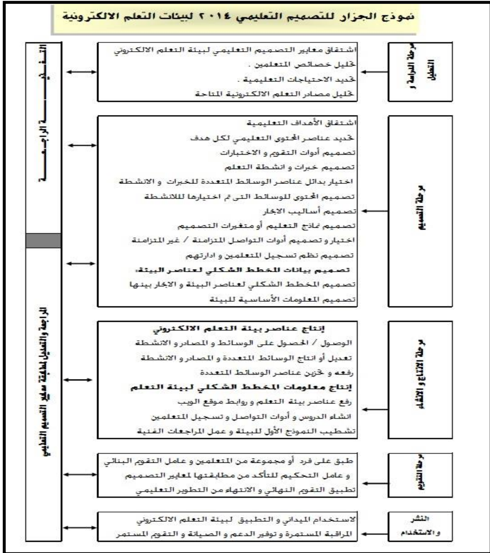
نموذج (١) نموذج التصميم المستخدم